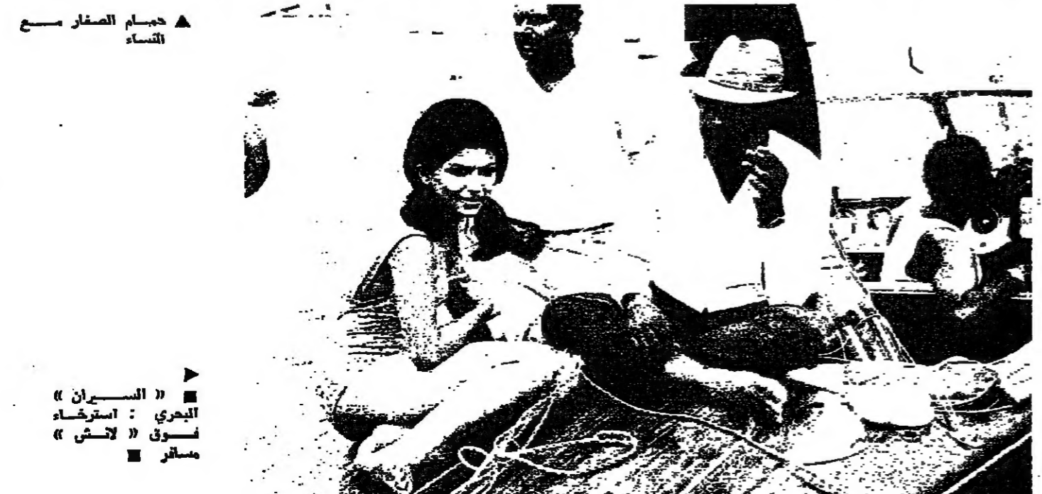
حجاب الصغار مع النساء